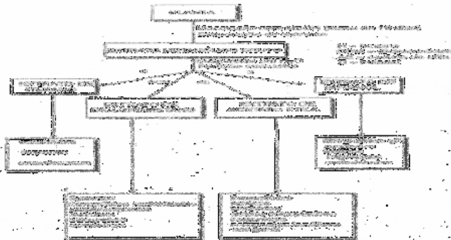
FIGURA 3. Preparação geral de extratos através de extrações a frio, a quente e por partição utilizando-se solventes aquosos ácidos ou básicos e solventes orgânicos imiscíveis em água.

O uso da Percolação foi o método utilizado por Marciel et al, (2002), objetivando demonstrar a importância de estudos multidisciplinares com plantas medicinais envolvendo a etnobotânica, química e farmacologia.