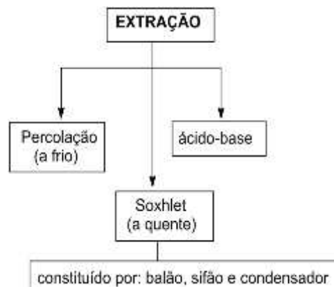
Figura 3. Preparação geral de extratos através de extrações a frio, a quente e por partição utilizando-se solventes aquosos ácidos ou básicos e solventes orgânicos imiscíveis em água.

A extração feita por percolação apresentou um menor risco de reações químicas, na formação de artefatos, decorrentes da ação combinada entre solvente e temperaturas elevadas, como mostra na Figura 3 . Os pesquisadores destacam que, as principais classes de constituintes químicos de plantas que podem ser detectadas com a aplicação de testes analíticos padrões são: ácidos graxos; terpenóides; esteróides; fenóis; alcalóides; cumarinas e flavonóides.