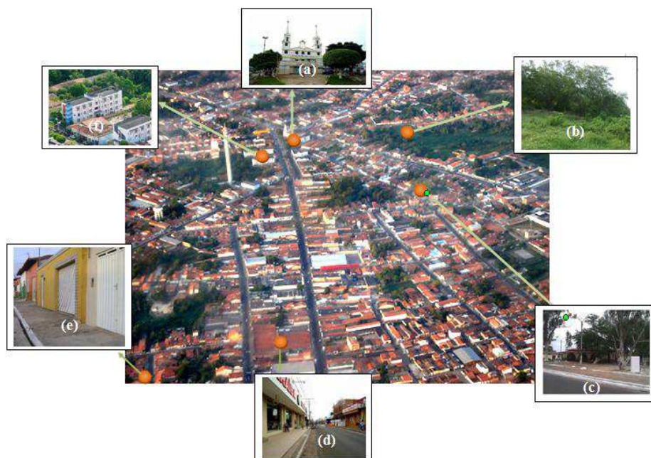
Figura 03 - Categorias de uso e ocupação do solo: (a) área institucional (Igreja Matriz); (b) Áreas desocupadas (terreno baldio); (c) Áreas de Lazer (praça da saúde); (d) Edificação comercial; (e) Edificação residencial; (f) Área Institucional (Poder Legislativo e Executivo de Santa Inês)