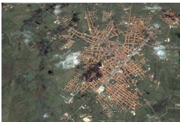
Figura 01 - Imagem de satélite do Núcleo Urbano de Santa Inês, 2009.

Situado na Microrregião Geográfica de Pindaré, a 45° 22' 48" de Longitude Oeste e 3° 40' 1" de Latitude Sul, possui uma Área Territorial de 768 km 2 . Seus limites são com os seguintes Municípios Pindaré e Igarapé do Meio ao Norte, com Santa Luzia e Brejo de Areia ao Sul, com Vitorino Freire e Bela Vista ao Leste e com os Municípios de Pindaré e Tufilândia a Oeste. A Figura 01 mostra o núcleo urbano do Município de Santa Inês.