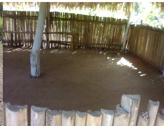
Figura 4: Salão de manifestações culturais.

O ecoturismo é a valorização de atributos locais e ambientais, além de servir como exemplo de novas formas de empreendedorismo rural e sustentabilidade ambiental, pois proporciona formas de ocupação, emprego e geração de renda com atividades não-agrícolas realizadas no meio rural. Essas atividades geram benefícios sociais e ambientais essencialmente interdependentes, onde os benefícios sociais advindos para as comunidades podem acarretar o crescimento global dos padrões de vida, devido ao estímulo econômico gerado pela maior visitação ao local com realização de trilhas, degustação de comidas típicas, pesca manual e venda de produtos artesanais. Igualmente, os benefícios ambientais surgem quando as comunidades são induzidas a proteger os ambientes naturais para sustentar o turismo economicamente viável.