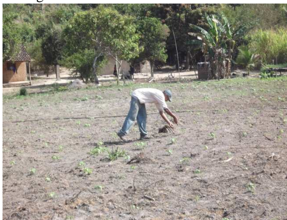
Figura 3: Plantio na comunidade Barra do Saco.

Quanto aos recursos culturais, foi possível acompanhar atividades do cotidiano dos moradores, tais como: plantio e colheita no campo, pesca realizada com as próprias mãos, apresentação de manifestações culturais, confecção de artesanato e realização de trilhas ecológicas.