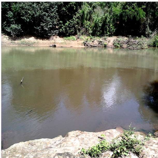
Figura 1: Encontro dos rios Saco e Codozinho.

Além disso, é importante que a comunidade possa também, ofertar aos visitantes recursos naturais e culturais diversificados, tais como o encontro dos dois rios Saco e Codozinho, já citados no texto anteriormente, que ao longo de seu extenso curso, possui águas límpidas e margens arborizadas que impedem a erosão do solo e conferem uma visão agradável, uma beleza singular e tranquilidade, como opção de lazer e fuga da tumultuada zona urbana.