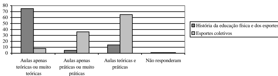
Figura 2 - Relação teoria/prática no ensino da história da educação física e dos esportes e nos esportes coletivos.

Nesse sentido, os alunos foram interrogados sobre a relação de aulas teóricas e práticas para cada conteúdo ministrado ao longo do ano letivo. A figura 2 apresenta duas situações extremas identificadas nas escolas pesquisadas sobre a relação teoria/prática na Educação Física.