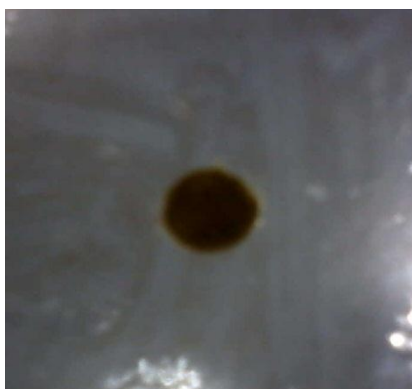
Figura 2. Resultado da fase ciclohexano.

Nos testes realizados frente a E. coli pode ser observado resultado negativo quanto a atividade antimicrobiana da fase ciclohexano (Figura 2). No entanto, observou-se que a fase diclorometano apresentou resultado positivo para o teste de atividade antimicrobiana com halo de inibição medindo 12 mm de diâmetro (Figura 3). De acordo com CHAVES (2002) estudos clínicos comprovam a eficácia do uso de Phyllanthus niruri em problemas relacionados a afecções do aparelho geniturinário, assim como, foram comprovadas suas ações antiviral na Hepatite B e urolitiásica. No uso popular, não é comum o uso da planta para problemas causados por E.coli como: infecção intestinal, colecistite, apendicite, meningite e outras que requerem uma atenção especial em seu tratamento.