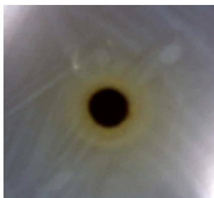
Figura 2. Resultado da fase diclorometano.