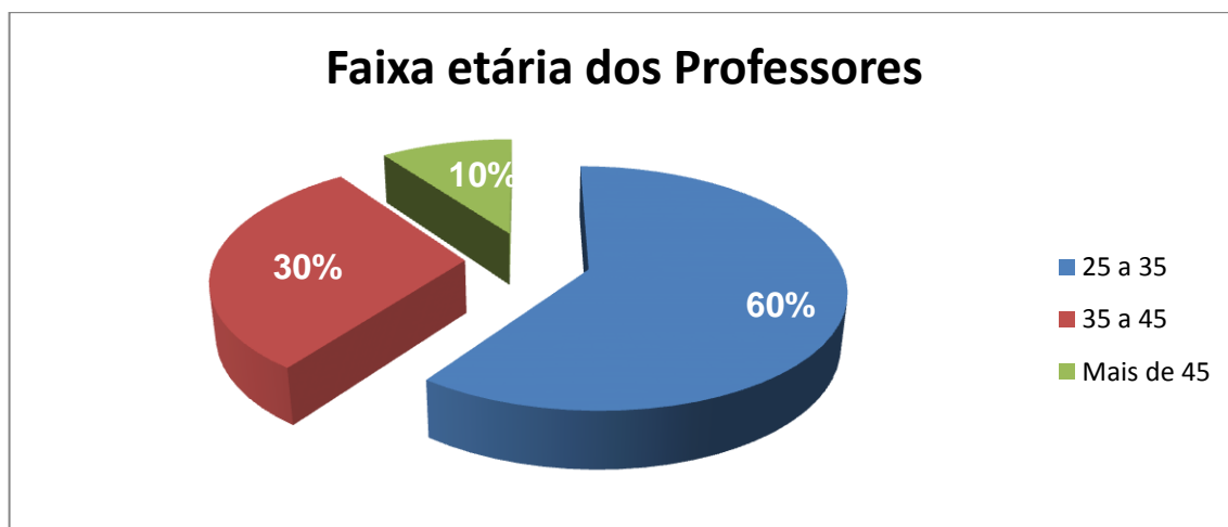
Gráfico 1: Perfil dos Professores: Faixa etária dos entrevistados

O perfil dos professores apresentados neste estudo revela uma predominância para o sexo masculino (90%). Em relação à faixa etária foi observado um público alvo relativamente jovem (60%) em contraste com o baixo número de professores que ultrapassavam os 40 anos (10%) (Gráfico 1).