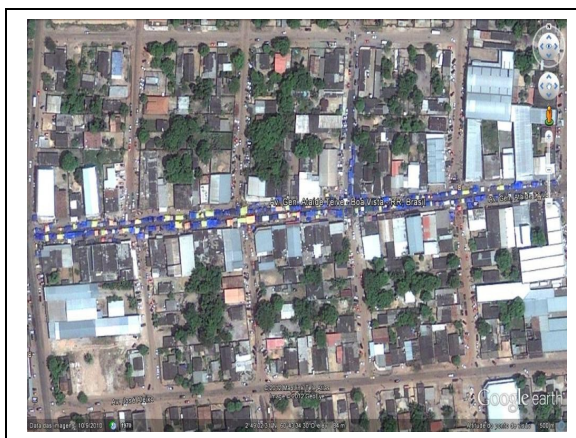
Figura 1 – Feira do Garimpeiro – Boa Vista/RR

A feira do Garimpeiro (Figura 1), tradicionalmente é realizada aos domingos. Está situada na avenida General Ataíde Teive, zona oeste da cidade de Boa Vista, sob as coordenadas geográficas 02°49'0,6"N e 60° 43'26", dividindo os bairros Asa Branca e Tancredo Neves.