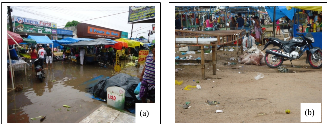
Figura 5 – Feira do Garimpeiro (a) desorganização; (b) lixo ao ar livre

Nas observações “ in loco ” verificou-se que não existem coletores de lixo para auxiliar durante o funcionamento da feira, de forma que os resíduos gerados durante a comercialização são lançados diretamente no chão (Figura 5), tal ação, como já foi relatado, ocasiona mau cheiro, e dificulta a limpeza da via após o seu funcionamento, que é realizado por uma empresa terceirizada, prestadora de serviço para a prefeitura do município de Boa Vista/RR.