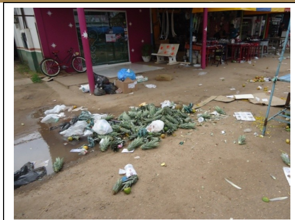
Figura 2 – Resíduos gerados na Feira do Garimpeiro

Nos questionamentos sobre a disposição dos resíduos gerados na feira, em frente dos estabelecimentos, 80% dos lojistas informaram que estes resíduos trazem transtornos a eles e aos clientes, tanto pelos problemas de estética quanto pelo mau cheiro que ocasiona, conforme mostra o gráfico da Figura 3.