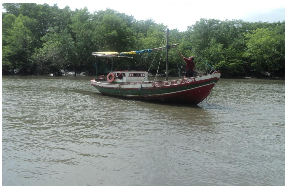
Figura 1: foto do pescador tirada no Porto de Mocajituba – Paço do Lumiar/MA