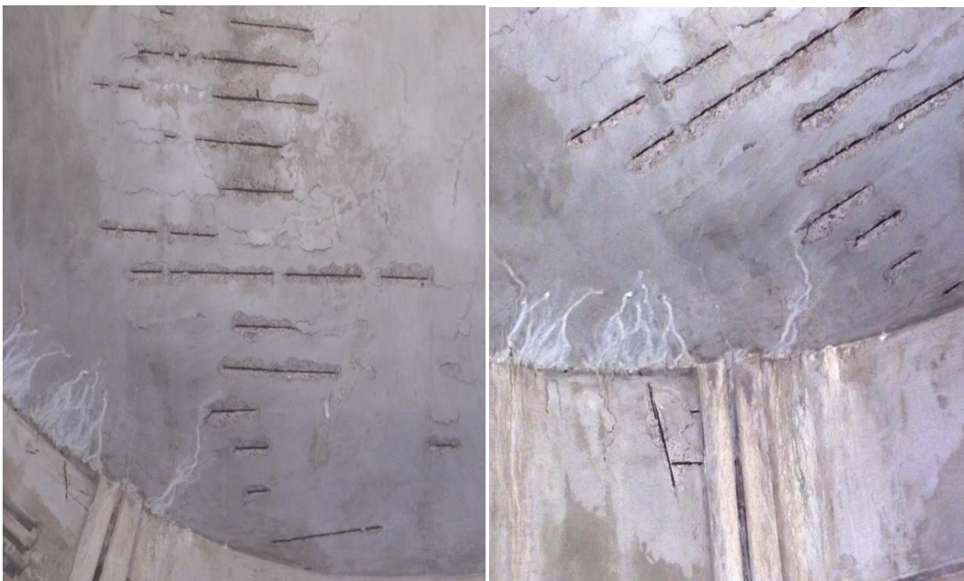
Figura 6 - Corrosão em laje.

A Figura 6, a seguir, mostra as patologias existentes nas lajes estudadas.