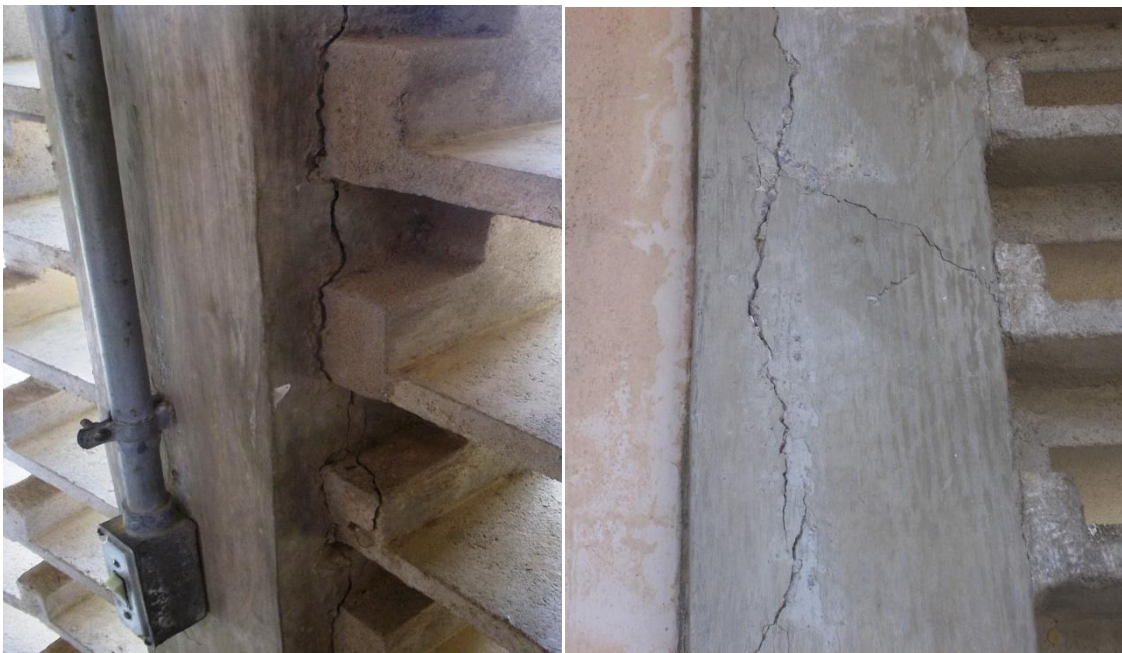
Figura 4 - Fissuras em pilares.

Observa-se nos pilares após o diagnóstico, esfoliação com lascamento de consideráveis proporções, provocando perdas relevantes da seção; cobrimento menor do que o previsto em norma e no projeto, permitindo a visualização da armadura em diversos pontos; corrosão da armadura com fissuras.