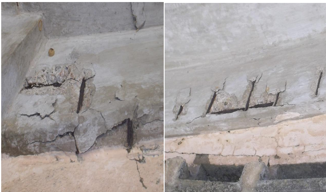
Figura 5 - Corrosão da armadura com fissuras em vigas.

Ao fazer o diagnóstico das vigas encontradas na escada e na rampa, verificaram-se problemas semelhantes aos dos pilares.