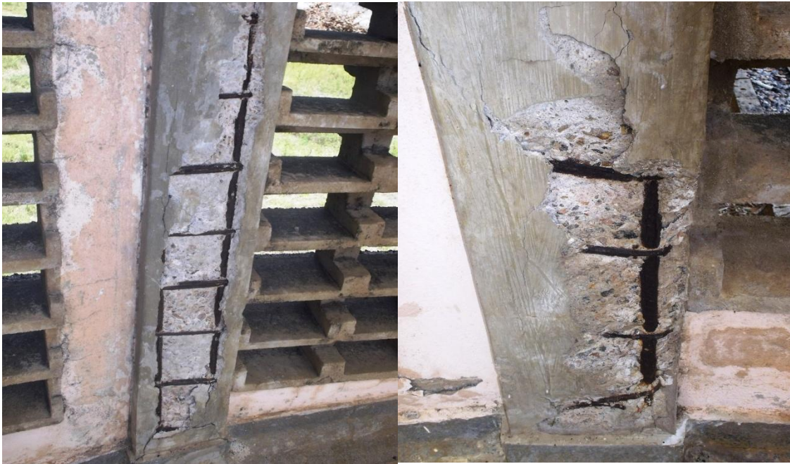
Figura 3 - Corrosão da armadura em pilares.