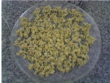
Figura 2 – Bagaço de caju utilizado como precursor na síntese do carbono ativado deste estudo.

volatilização de compostos orgânicos leves devido o processo carbonização em que elevada a temperatura a 400 °C. Também foi evidente a dificuldade no momento da lavagem do adsorvente (pós-síntese) com água destilada, sendo necessário a repetição do procedimento por 5 vezes.