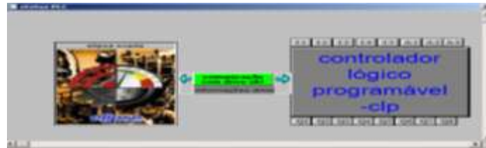
Figura 1 – Tela de comunicação

A Figura 2 representa a tela do emulador Modbus onde é possível ler e escrever valores que iríamos comunicar em posições de memória de um clp que usa esse tipo de protocolo. Com as tags CLP do supervisório ELIPSE SCADA foi possível ler e escrever valores em posições dos endereços do emulador. Com isso foi possível visualizar e enviar valores para set points e outras tags (tipo RAM) onde foi simulado e forçado valores de entradas do tipo digital e analógicas devidamente configuradas em cada tag CLP, respeitando as regras e operações do protocolo.