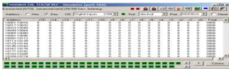
Figura 2 – Emulador Modbus

A Figura 2 representa a tela do emulador Modbus onde é possível ler e escrever valores que iríamos comunicar em posições de memória de um clp que usa esse tipo de protocolo. Com as tags CLP do supervisório ELIPSE SCADA foi possível ler e escrever valores em posições dos endereços do emulador. Com isso foi possível visualizar e enviar valores para set points e outras tags (tipo RAM) onde foi simulado e forçado valores de entradas do tipo digital e analógicas devidamente configuradas em cada tag CLP, respeitando as regras e operações do protocolo.