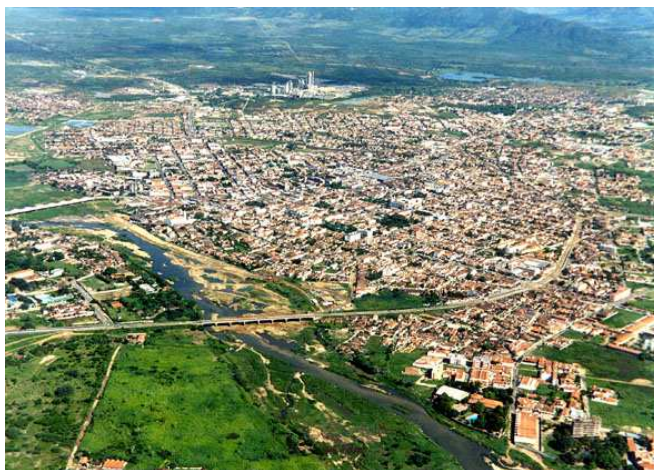
Figura 2 – Vista aérea do município de Sobral, Ceará.

Expõe-se na tabela nº1 acima, quanto à área territorial que Sobral apresenta o dobro de extensão de área do município de Campos Sales e sobre o número de habitantes essa diferença é ainda maior, pois o município de Sobral tem um numero sete vezes mais que Campos Sales. Em relação ao Índice de Desenvolvimento Humano – IDH, sabe-se que o estado do Ceará tem o IDH de 0,723 ( PNUD 2005) constatando-se que os dois municípios estão abaixo do valor estadual, ressaltando-se a diferença dos valores entre eles, indicando um valor maior para a cidade de Sobral, porém pelo desenvolvimento do mesmo esperava-se maior IDH, haja vista que, a porcentagem de urbanização é maior em Sobral (ver figura 2) e o PIB de Sobral é cerca de 20 vezes maior que o de Campos Sales, indicando seu porte econômico.