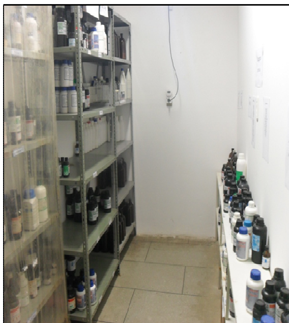
Figura 3: Organização da sala de reagentes.