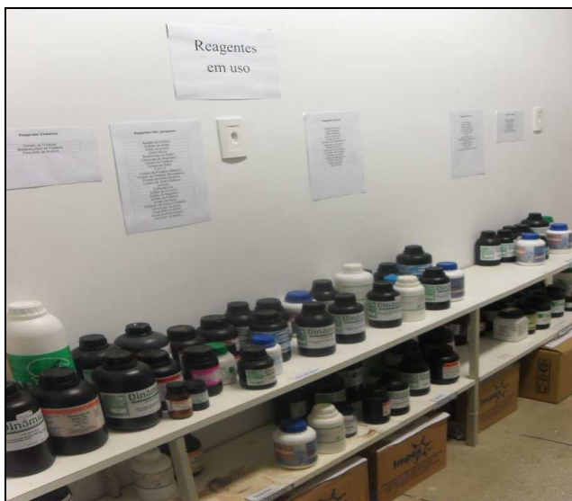
Figura 1: Reagentes em uso.

funcionar. Assim como mostra as imagens abaixo a sala de reagentes foi organizada da seguinte forma: foram separados primeiramente os reagentes líquidos dos sólidos, depois foram separados os reagentes em uso, os vencidos e os reagentes em estoque. Os reagentes em uso foram separados dos demais para ajudar na organização da sala e para que se tenha uma organização no próprio uso dos reagentes, pois dessa maneira somente um frasco de cada substância estará em uso. Com o espaço de estoque tem-se um controle na quantidade dos reagentes e também na própria organização da sala.