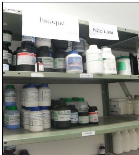
Figura 4: Estoque de reagentes.