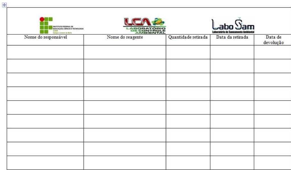
Figura 6 - Modelo da ficha de uso dos reagentes