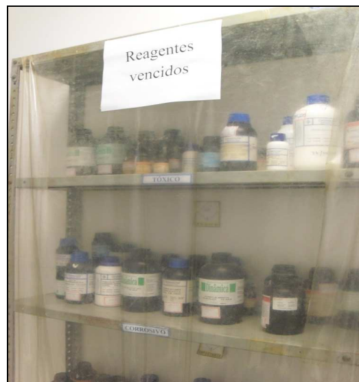
Figura 2: Reagentes vencidos. Fonte: FERREIRA, (2012).