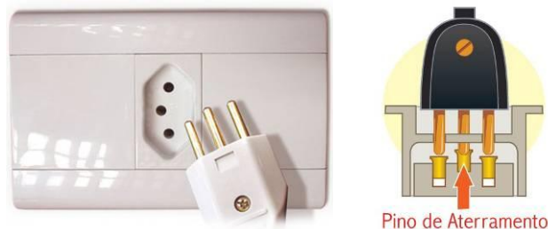
Figura 1 – Novo padrão brasileiro de plugues e tomadas.

equipamentos, protegendo o usuário. Sua presença nas unidades habitacionais é quase indispensável pelo número de equipamentos que possuem este condutor.