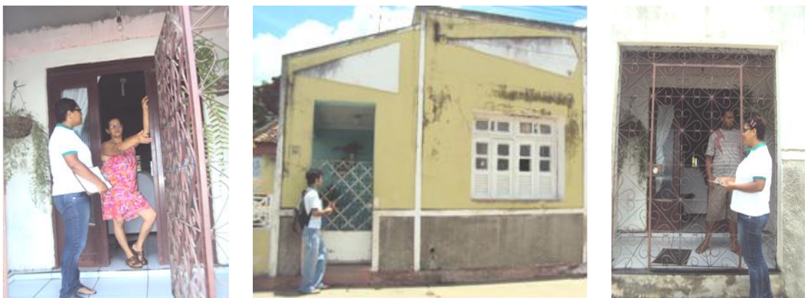
Figura 6 – Visitas aos domicílios.

A metodologia adotada considerou o estudo de residências, em sua maioria, com área construída inferior à 50 m 2 . A abordagem foi realizada diretamente nos domicílios (Figura 6).