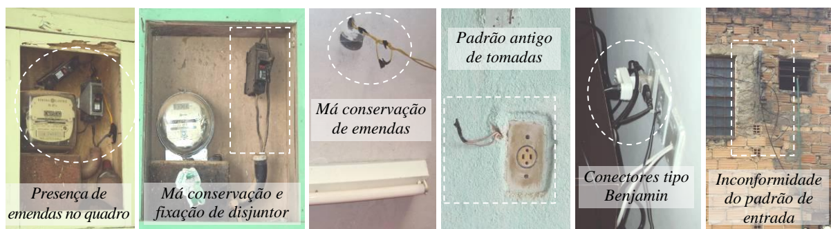
Figura 7 – Algumas das inconformidades verificadas.

Aproximadamente 100 residências foram visitadas. Alguns dos principais são apresentados na Tabela 1.