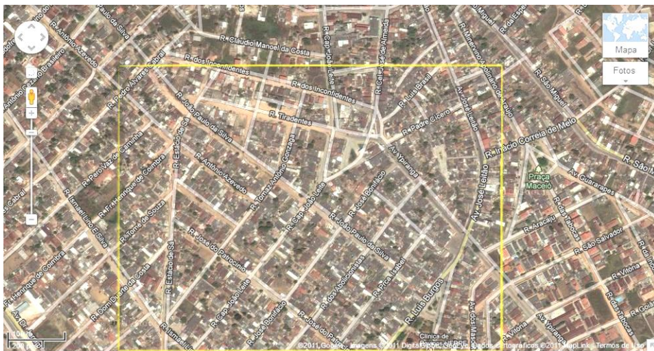
Figura 3 – Área delimitada no bairro do Mundaú – Garanhuns (PE).