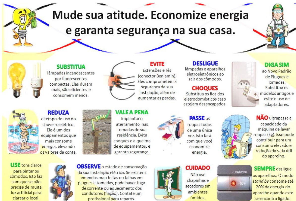
Figura 9 – Panfleto explicativo apresentado nas áreas de estudo.