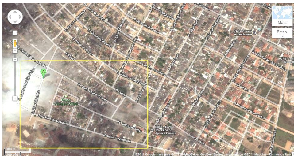
Figura 4 – Área delimitada no bairro do Magano – Garanhuns (PE).

Registraram-se algumas dificuldades durante a realização das atividades, as quais podem ser citadas a baixa permissividade dos indivíduos quanto ao acesso da equipe à parte interno na maioria das residências, que se justificava pela necessidade de verificar as condições físicas das instalações. A esta adiciona-se a dificuldade de informações sobre a área construída das residências. Notou-se também diferenças na receptividade e relações interpessoais, a qual variava de acordo com a condição socioeconômica das famílias e seu grau de instrução.