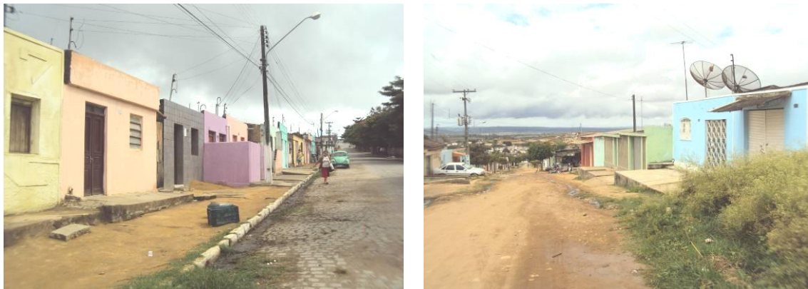
Figura 5 – Algumas das áreas mapeadas para estudo no município de Garanhuns (PE).

Após análise das constatações preliminares foram realizados ajustes até o instrumento final, contemplando circuitos de proteção, estado físico das instalações, uso de benjamins (Tês) e extensões, situação de emendas, adoção do novo padrão de plugues e tomadas, presença/ausência de aterramento, além de outros aspectos, incluindo-se questões de eficiência energética. As regiões nos bairros do Mundaú e Magano foram então exploradas para a retirada de informações.