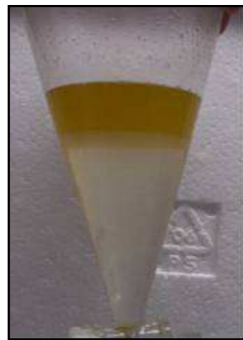
Figura 3b - Lavagem do biodiesel de linhaça

Para preparação do biodiesel de linhaça foi utilizado um balão de fundo chato com três bocas, acoplado na boca central a um condensador de Allihn tipo bola de 200mm, em uma das bocas lateral foi feita a medição da temperatura com um termômetro digital, esse sistema foi colocado em mesa agitadora a temperatura ambiente. Pesou-se 30 mL de óleo de linhaça em balança analítica, a fim de descobrir a densidade do óleo tendo como resultado: 0,847 g/mL; e por meio da densidade obteve-se a massa do óleo (133 g) para o volume determinado 157 mL do óleo de linhaça, sendo este adaptado ao balão de 250 mL. Adicionou-se o óleo a mistura 1,33g de catalisador (KOH) e 73mL de álcool metílico, e deixou-se a 25°C por um hora com agitação constante. Após o repouso de 12 horas, a glicerina foi retirada e o conteúdo restante da mistura foi submetido ao procedimento de lavagem com água destilada a 80°C até a neutralização da água (pH 7,0), para a purificação dos ésteres (Figura 3b). Foi realizada a filtragem do biodiesel usando o sulfato de sódio anidro (Figura 4) a fim de retirar o excesso de álcool, o biodiesel foi submetido às mesmas análises que o biodiesel de soja.