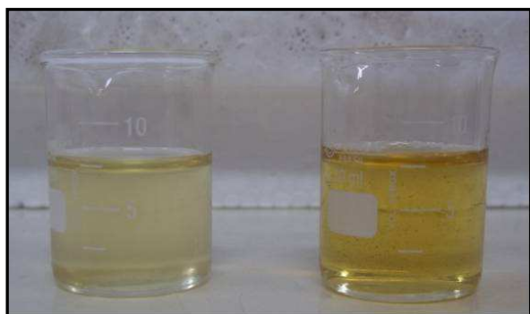
Figura 6a – Biodiesel de soja (amarelo mais claro) e glicerina (amarelo mais escuro) formados.