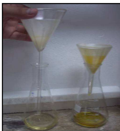
Figura 4 – Sulfato anidro aplicado a cada biodiesel (soja e linhaça) para retirada da água

Para preparação do biodiesel de linhaça foi utilizado um balão de fundo chato com três bocas, acoplado na boca central a um condensador de Allihn tipo bola de 200mm, em uma das bocas lateral foi feita a medição da temperatura com um termômetro digital, esse sistema foi colocado em mesa agitadora a temperatura ambiente. Pesou-se 30 mL de óleo de linhaça em balança analítica, a fim de descobrir a densidade do óleo tendo como resultado: 0,847 g/mL; e por meio da densidade obteve-se a massa do óleo (133 g) para o volume determinado 157 mL do óleo de linhaça, sendo este adaptado ao balão de 250 mL. Adicionou-se o óleo a mistura 1,33g de catalisador (KOH) e 73mL de álcool metílico, e deixou-se a 25°C por um hora com agitação constante. Após o repouso de 12 horas, a glicerina foi retirada e o conteúdo restante da mistura foi submetido ao procedimento de lavagem com água destilada a 80°C até a neutralização da água (pH 7,0), para a purificação dos ésteres (Figura 3b). Foi realizada a filtragem do biodiesel usando o sulfato de sódio anidro (Figura 4) a fim de retirar o excesso de álcool, o biodiesel foi submetido às mesmas análises que o biodiesel de soja.