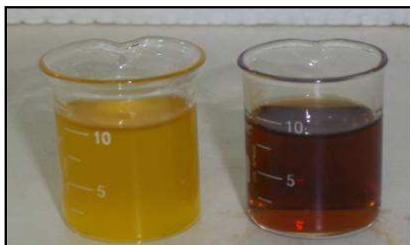
Figura 6b – Biodiesel de linhaça (amarelo mais escuro) e glicerina (marrom mais escuro) formados.

A partir dos resultados apresentados na Tabela 1, observa-se que o pH do biodiesel de soja, após lavagem com água a 80°C, encontrou-se adequado e neutro, conseqüentemente, indicando um índice de acidez de 1,395(mgKOH)/g; como o biodiesel de linhaça demonstrou pH muito alto isso pode indicar um óleo bastante antigo, com perdas de propriedades, e assim, o índice de acidez não pôde ser indicado. Porém, os ácidos graxos livres para a linhaça totalizaram 0, 113%. Os óleos vegetais apresentaram pHs considerados ácidos nesta faixa e densidades também adequadas já que o biodiesel realizado destes óleos apresentaram uma densidade menor, certamente ocasionado pelo processo de transesterificação. Porém, o biodiesel de linhaça apresentou densidade menor, mas ainda considerada alta, mais estudos devem ser realizados para esse parâmetro. Os ácidos graxos livres para os óleos vegetais não foram realizados, mas o serão em etapa posterior.