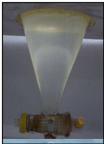
Figura 3 a - Lavagem do biodiesel de soja

processo de purificação e foram feitos os seguintes ensaios físico-químicos: pH, densidade, índice de acidez e ácidos graxos livres.