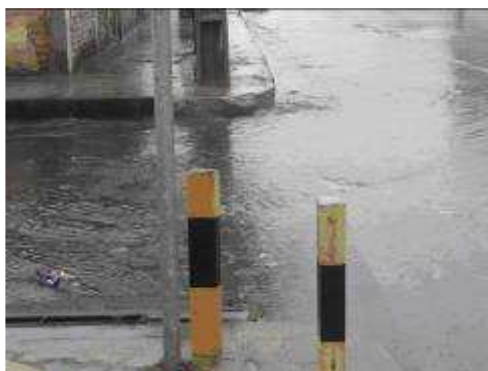
Figura 04. Quadra 19. Sarjetas transbordando.

As sarjetas não estão mais comportando a quantidade de chuva que cai atualmente, provocando um transbordo da lâmina d'água para toda a via pública e calçada prejudicando a passagem de pedestres e veículos. (ver figura 01 e 04).