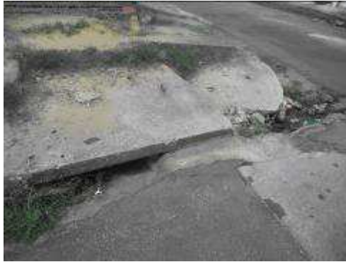
Figura 02, boca de lobo sem grelha, Quadra 32. CALISTO, 2012

mas somente a presença de parte dos elementos que compõe o Sistema de drenagem, que são greide, guia e sarjetas que ficam saturadas nos momentos de chuva intensa. As galerias mais próximas ficam localizadas a distância estimada de 100 metros (ver figura 02), próximo a também se observou na área o escoamento ineficiente em tempo hábil.