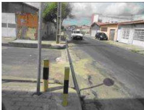
Figura 03. Quadra 19 Via pública.

Não houve a verificação da existência de empossamentos no ponto observado após o período chuvoso. O sentido do escoamento da água é o rio Parnaíba, à direita da figura 01.