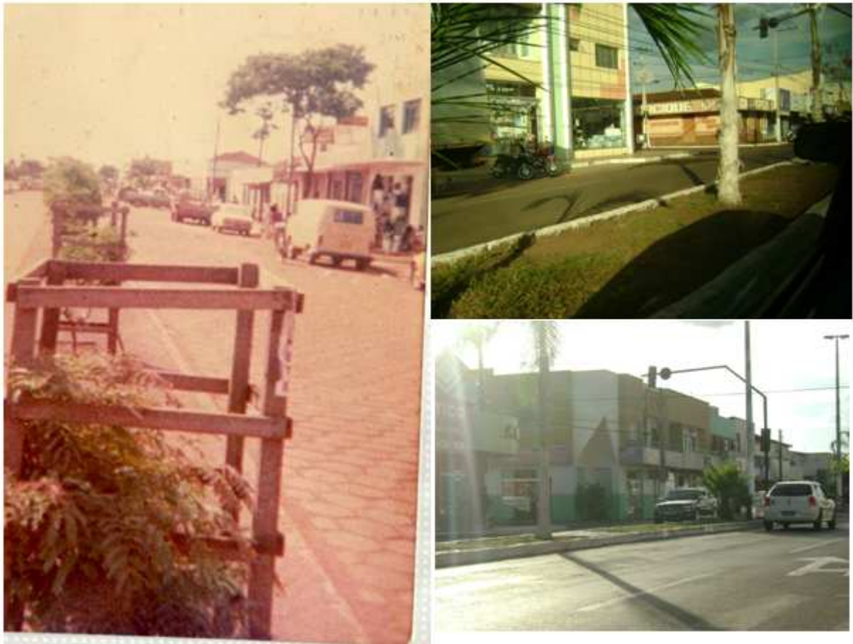
Figura 3: Imagens da vista parcial da Av. Bernardo Sayão. 01.Foto maior (1981). 02 e 03, fotos menores.

A partir de uma pesquisa de campo realizada com os moradores dos bairros popularmente conhecido como setores onde expressaram peculiaridades, necessidades, aspectos culturais e sociais e problemas de infraestrutura podemos perceber vários problemas.