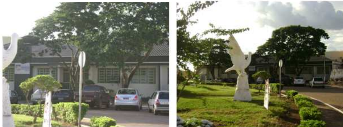
Figura 2: Museu Municipal (antigo Forum) (2012).

Muitas destas obras já passaram por várias transformações, como é o caso do prédio da figura 1, hoje Museu Municipal.