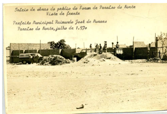
Figura 1: Obras prédio do Fórum (1970).

Desde então varias obras foram realizadas, construção do Fórum, encanamento, pavimentação entre outros.