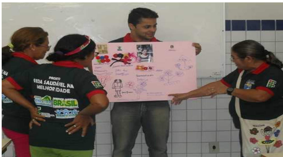
Figura 1 – Apresentação do seminário ‘Minha Vida’

O seminário foi feito com os alunos onde foram realizadas práticas com alguns objetos significativos para eles, tais como fotos, brinquedos e pertences pessoais que representaram e que foram de suma importância na sua vida, no presente ou no passado. Os grupos foram organizados em trios, onde cada um dos integrantes deveria relatar sobre fatores que tiveram grande significância para com a vida deles, ressaltando a importância de cada item posto no cartaz, expondo seus costumes, práticas, recordações, relatos pessoais, com a tarefa de apresentar o feito para toda a turma, o que também contou como ponto positivo, melhorando na interação e melhor vivência do grupo. Essa foi uma atividade bastante proveitosa, sendo que foi possível trabalhar diversos aspectos, os fatores educacional, social, cultural e, sobretudo, o fator emocional que foi algo bastante ressaltado nessa atividade. Abaixo (Figura 1) temos uma imagem que faz referência à atividade executada.