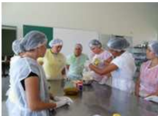
Figura 3: Curso ministrado para terceirizados do IF Sertão – Campus Petrolina

Um das dificuldades encontradas inicialmente está relacionada com o preconceito que muitas pessoas tinham em relação a aproveitar descartes para elaboração de pratos alimentícios, pois esse fato só ocorria em programas sociais do governo com pessoas de baixa renda. Os cursos têm ajudado bastante no esclarecimento da importância da utilização desses descartes e o verdadeiro sentido do aproveitamento. Sendo assim, os mini-cursos tem contribuído positivamente para o despertar das comunidades carentes localizadas no entorno do IF Sertão, de servidores e alunos do instituto (Figura 3), assim como pessoas de outras regiões nas localidades de Petrolina-PE e Juazeiro-BA (Figura 4). Neles os participantes além de aprenderem o valor nutricional dos resíduos antes descartados, também confeccionam produtos, recebem treinamentos básicos de Boas Práticas de Manipulação dos Alimentos e são levados a partir disso desenvolverem uma fonte de renda, já que as formulações são de baixo custo. São mais de quinhentas pessoas capacitadas, entre comunidades, projetos sociais, alunos e servidores do IF Sertão. Desses, alguns abriram seu próprio negócio, com produção caseira de doces, salgados e refeições.