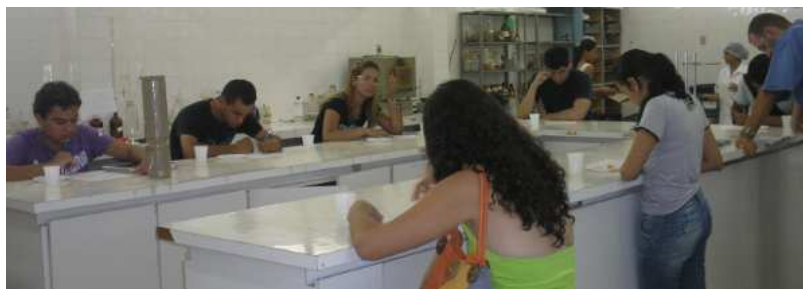
Figura 1: Análise sensorial para verificar aceitabilidades dos produtos

Na figura 1 pôde-se observa a análise sensorial feita para a torta salgada elaborada com cascas de vegetais, já na figura 2 encontra-se os resultados de aceitação do produto, onde demonstra boa aceitação, atingindo 97,3% para o atributo de gostei contra 2,7% para não gostei.