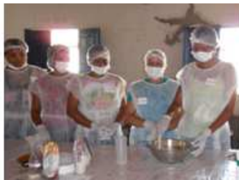
Figura 4: Curso ministrado em comunidades de Petrolina