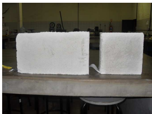
Figura 5 – Reboco assentado

Verificou-se ainda que a utilização dos resíduos vítreos pode ser sim empregada na construção civil como agregado nas argamassas para reboco (Figura 5), tendo em vista que é um material com pouca ou nenhuma absorção de água e apresentando como resultado uma resistência superior ao material convencional (areia) enquadrando-se como argamassas Padrão II e III (NBR 13279, 2005).