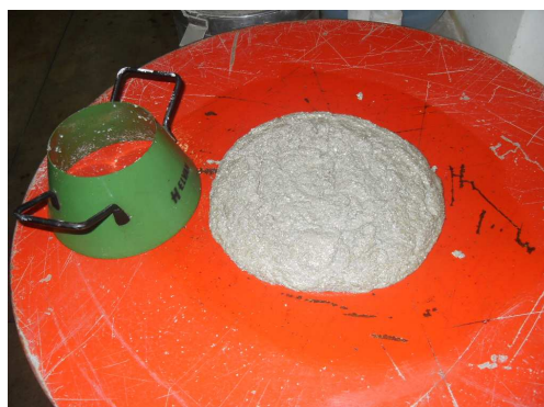
Figura 1 – Índice de consistência

5) Caracterização dos materiais: aglomerante e agregados.