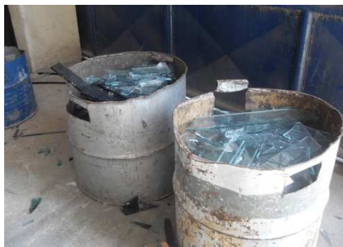
Figura 2 – Resíduos vítreos coletado

Durante a realização das visitas e de acordo com as respostas apresentadas no questionário aplicado às empresas, pôde-se constatar que os proprietários de vidraçarias maiores comercializam uma grande quantidade de vidro plano (Figura 2) e que as vidraçarias de menor porte compram destas, boa parte de material para sua produção. Observou-se ainda que as empresas de grande porte do ramo de vidraçarias são responsáveis pela compra de todo o material vítreo comercializado no município de Boa Vista-RR, com desperdício médio de 17,50% enquanto as vidraçarias de pequeno porte, que são abastecidas por empresas de poder aquisitivo maior, têm um desperdício médio de 45,00%, tendo em vista que as empresas de grande porte vendem as lâminas para as empresas menores bem como repassam para estas a perda que seria de sua empresa, ou lançam estes resíduos diretamente no aterro sanitário.