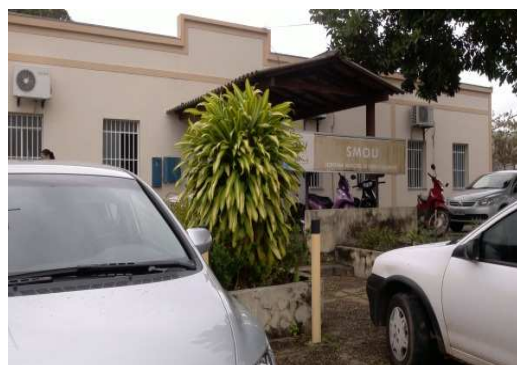
Figura 3 Sup. de Iluminação Pública, 2012.

De acordo com dados fornecidos pela Superintendência de Iluminação Pública, atualmente o total de lâmpadas sendo utilizadas no parque de iluminação do município é de 43.480 mil, sendo que desse total 3.509 mil possuem vapor de mercúrio em sua composição (Figura 4) e as demais, apresentam o vapor de sódio (Figura 5).