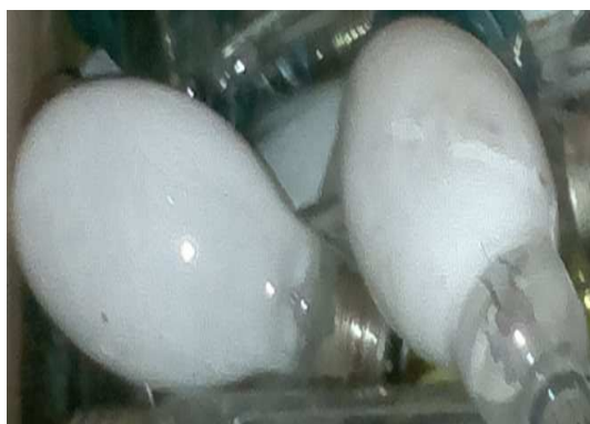
Figura 4 Lâmpadas contendo mercúrio, 2012

De acordo com dados fornecidos pela Superintendência de Iluminação Pública, atualmente o total de lâmpadas sendo utilizadas no parque de iluminação do município é de 43.480 mil, sendo que desse total 3.509 mil possuem vapor de mercúrio em sua composição (Figura 4) e as demais, apresentam o vapor de sódio (Figura 5).