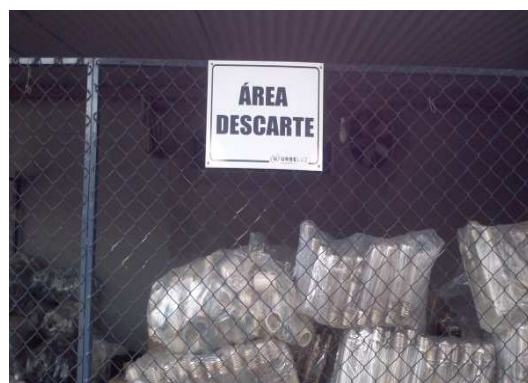
Figura 9 Área de descarte da Urbeluz, 2012.

Segundo informações coletadas “ in loco ”, após serem encaminhadas ao depósito da Prefeitura, as lâmpadas são quebradas e/ou trituradas para logo em seguida serem acondicionadas em tambores que estão dispostos dentro do depósito reservado para esse fim. Constatou-se, no entanto, que o destino final dado às lâmpadas fluorescentes pós-consumo, além de provisório é inadequado, pois a quebra desses resíduos é imprópria já que a partir do rompimento das lâmpadas ocorre a liberação do vapor de mercúrio e, conseqüentemente, a poluição do ar atmosférico, bem como a contaminação dos manipuladores e seres vivos em geral.