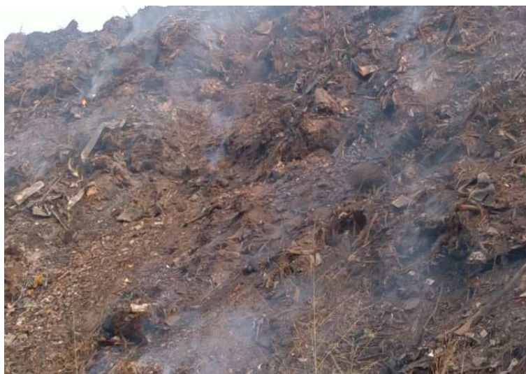
Figura 12 Montanha de lixo no aterro sanitário com presença de fogo e fumaça, 2012.

atmosfera gases poluidores do ar e destruidores da camada de ozônio, trazendo riscos de explosões, além de possibilitar o rompimento de materiais de vidro, como as lâmpadas fluorescentes, o que possibilita a poluição do solo, dos lençóis freáticos e da biota pelo mercúrio inerente a esse tipo de lâmpada.