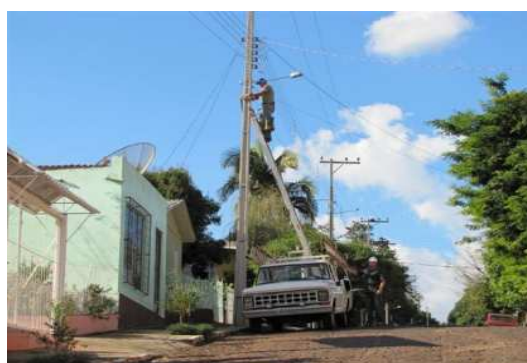
Figura 6 Urbeluz faz reparos na iluminação pública.

É importante ressaltar que, realizaram-se três visitas à Superintendência de Iluminação Pública com a finalidade de obter mediação junto à Urbeluz, já que grande parte das informações e dados necessários para a continuidade da pesquisa e fechamento deste relatório foi coletada na referida empresa, que é responsável pela manutenção do serviço de iluminação pública no município como, por exemplo, reposição de fios danificados ou daqueles que são furtados e troca das lâmpadas queimadas ou danificadas por ações de vandalismo, conforme demonstra a Figura 6.