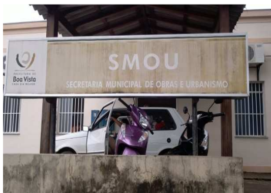
Figura 2 Prédio da SMOU de Boa Vista, 2012.