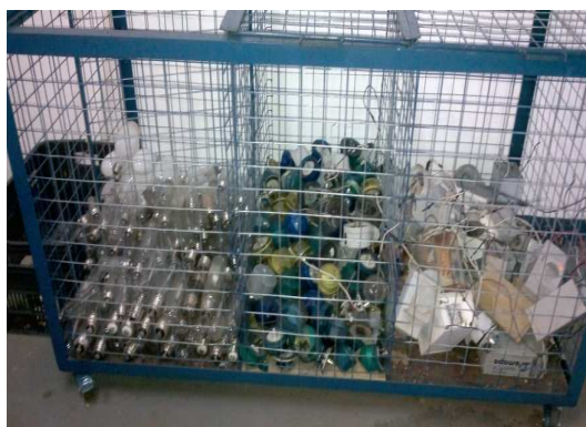
Figura 7 Contêiner utilizado na separação das lâmpadas, 2012.

Além de fazer a manutenção do serviço de iluminação pública no município, a Urbeluz também é responsável pelo controle da quantidade de lâmpadas pós-consumo geradas em determinado período de tempo, além de participar da fase inicial do processo de destinação final das lâmpadas, já que tem por incumbência recolher do parque de iluminação pública as lâmpadas inutilizadas, para então tecnicamente realizar a triagem do material, conforme demonstra a Figura 7.