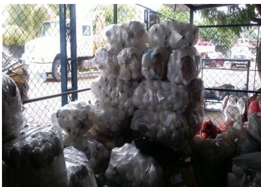
Figura 8 Lâmpadas embaladas, 2012.

Em seguida, as lâmpadas são acondicionadas em embalagens plásticas resistentes e, por fim, estocadas na área de descarte (Figuras 8 e 9), até que sejam removidas para o depósito da Prefeitura.