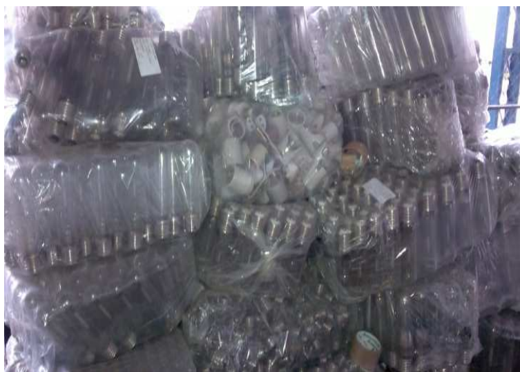
Figura 10 Lâmpadas fluorescentes embaladas e estocadas, 2012.

Infelizmente, a visita ao Aterro Sanitário de Boa Vista, de extrema contribuição para a pesquisa, ainda não foi autorizada pelo órgão responsável, Superintendência de Serviço Ambiental da Prefeitura, apesar de ter sido encaminhado, no dia 25.06.2012, um documento solicitando autorização da coleta de dados no local. Segundo o superintendente de serviço ambiental, as visitas somente serão liberadas após o término do período chuvoso.