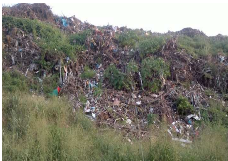
Figura 11 Montanha de lixo no Aterro Sanitário, 2012.

Apesar de ainda não ter sido possível o acesso ao interior do aterro, efetuou-se visita “ in loco ” a sua área externa, onde se observou uma verdadeira montanha de lixo contendo os mais variados tipos de resíduos sólidos, conforme ilustrado na Figura 11, dentre os quais possivelmente estão inseridas as lâmpadas fluorescentes.