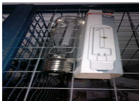
Figura 5 Lâmpadas a vapor de sódio, 2012.

É importante ressaltar que, realizaram-se três visitas à Superintendência de Iluminação Pública com a finalidade de obter mediação junto à Urbeluz, já que grande parte das informações e dados necessários para a continuidade da pesquisa e fechamento deste relatório foi coletada na referida empresa, que é responsável pela manutenção do serviço de iluminação pública no município como, por exemplo, reposição de fios danificados ou daqueles que são furtados e troca das lâmpadas queimadas ou danificadas por ações de vandalismo, conforme demonstra a Figura 6.