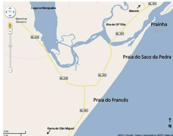
Figura 1 – Área de estudo (região costeira de Marechal Deodoro)

Assim como o litoral brasileiro, a zona costeira deodorense abriga uma diversidade vital e de alta relevância ambiental. É, portanto, constituída de diversos ecossistemas interdependentes e alterna-se entre restingas, manguezais, remanescentes de Mata Atlântica, recifes de coral, praias (Prainha, Praia do Saco da Pedra e Praia do Francês), estuários e lagunas (como o Complexo Estuarino-Lagunar Mundaú/Manguaba – CELMM: o mais importante ecossistema do Estado, detentor de alta biodiversidade endêmica embora, ameaçada de extinção em sua maioria).