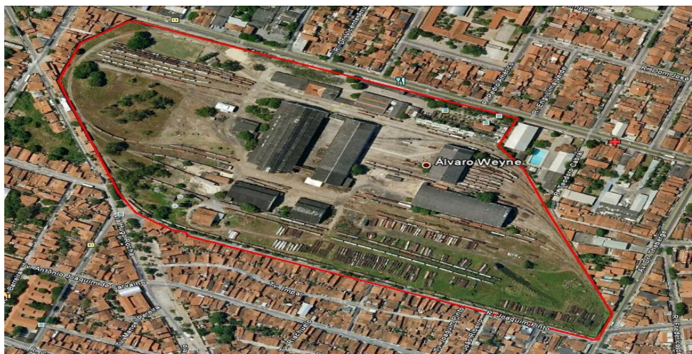
Figura 1 – Visão aérea dos limites do complexo

O Complexo Ferroviário possui área total de 187.680,00m 2 . A área em estudo está representada na figura 1.