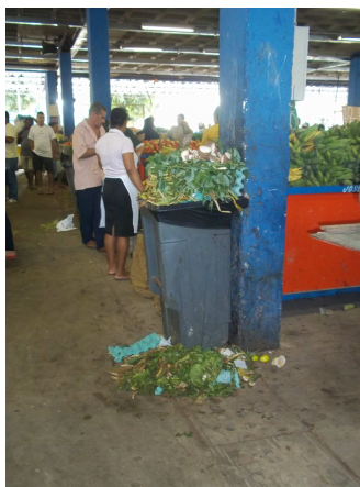
Figura 02 – disposição dos resíduos sólidos

Foi identificada também a disposição inadequada dos resíduos, que esta relacionada com a maior geração em quantidade de resíduos, fluxo de clientes e vendas. Conforme pode ser observado na figura 02, os resíduos do setor de hortifruit, em dias de maior produção, estão dispostos indevidamente pelos corredores de acesso, fora dos cestos de coleta, entre as bancas, etc.