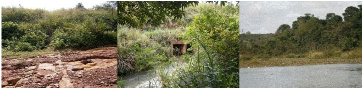
Figura 1. Fotografias dos pontos estudados, P1, P2 e P3, respectivamente.

Além destas etapas fez-se a sensibilização da comunidade a fim de se mostrar a importância deste recurso hídrico.