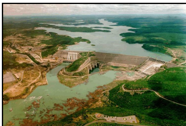
Figura 2 - Vista aérea da Unidade Hidrelétrica de Xingó.