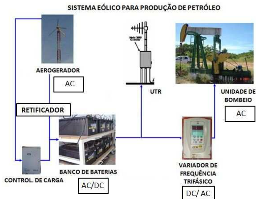
Figura 2- Modelo para tornar mais viável a utilização da energia eólica

Para que o aproveitamento de energias renováveis ocorra de forma viável é necessário melhorar o sistema, conforme a figura 2. Neste novo esquema, pretende-se aumentar a eficiência em mais de 90%, pois no esquema convencional as eficiências calculadas do conversor DC/AC monofásico para o inversor de frequência ficam em torno de 74%. Para atingir esta eficiência o inversor de frequência trifásico será alimentado de forma direta através do banco de baterias, com isso, não será necessária a conversão AC/DC do inversor monofásico, como ocorre atualmente. Além de aumentar a eficiência, este sistema deve possuir tamanho e custos reduzidos. Desta forma, a pesquisa neste momento inicial tem como primeiro objetivo: dimensionar o aerogerador de forma que ele forneça uma potência elétrica adequada à unidade de bombeio mecânico.