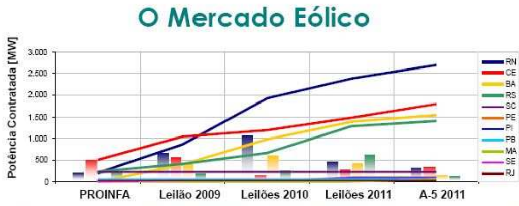
Figura 4- Potência nominal de eólica contratada por estado

Nos estudos sobre o potencial no Nordeste do Brasil, os Estados do Ceará e Rio Grande do Norte, apresentam, em alguns locais, um fator de capacidade (FC) que pode superar o valor de 0,4. Comparados com os valores médios da Alemanha (FC de 0,23) nota-se um grande potencial a ser explorado [5]. Com todo esse potencial à disposição, o aproveitamento eólico potiguar está mudando, pois através dos leilões de energia do governo federal (Figura 4) centenas de parques estão saindo do papel e gerando uma série de empregos e investimentos bilionários, principalmente na fase de construção.