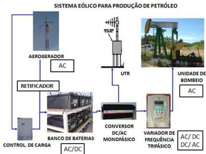
Figura 1 – Utilização de energia eólica pela PETROBRAS para alimentar a unidade de bombeio

A proposta deste projeto é substituir o método de alimentação convencional das unidades de bombeio mecânico (que são alimentadas através de energia elétrica) por fontes alternativas de energia como a energia eólica, por exemplo. Embora as unidades da PETROBRAS do Rio Grande do Norte e Ceará já a utilizem, em alguns campos de petróleo, sistemas de fontes de energias alternativas (figura 1) estes sistemas apresentam problemas como, por exemplo, alto custo de aquisição, elevadas perdas e baixa confiabilidade.