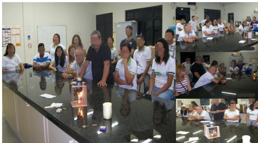
Figura 2 - Momento da aplicação do Calorímetro (2ª semana da pesquisa).

Apesar de não podermos divulgar o rosto dos participantes, durante a execução da prática, foi observado que muitos alunos, ao observarem o experimento, demonstraram uma expressão de contentamento ao ver tal situação. Isto ocorre devido a uma curiosidade aguçada e a uma admiração ao perceber, de fato, a ciência em um sentido macroscópico e não apenas em uma visão distante da realidade.