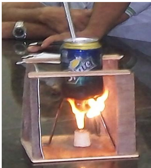
Figura 1 - Calorímetro Alternativo.

Após o vídeo, trabalhou-se o assunto Calorias de forma experimental e, para tal, foi utilizado um Calorímetro Alternativo (CA) (Figura 1). A ideia da construção do CA foi fundamentada a partir dos autores Usberco & Salvador (2002).