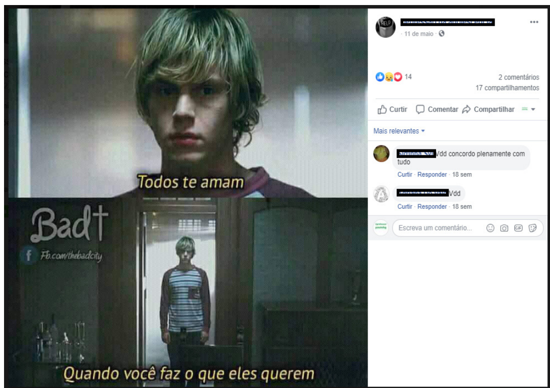
Figura 2 – Postagem abordando o sentimento de indiferença do próximo

Em continuidade, a figura 2 demonstra que os adolescentes se sentem pouco acolhidos, faltando oportunidade para refletirem sobre todos os riscos aos quais estão expostos diariamente e, com isso, impossibilitados de reformularem suas opiniões, pensarem sobre seus hábitos e sobre possíveis soluções que podem ocorrer com o compartilhamento do seu problema com o próximo (BENINCASA; REZENDE, 2006):