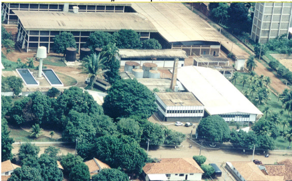
Figura 1 – Empresa Tobasa

Segue na figura 1, a vista aérea da empresa instalada no município de Tocantinópolis/TO, e que apresenta em sua missão a grande preocupação com sustentabilidade: