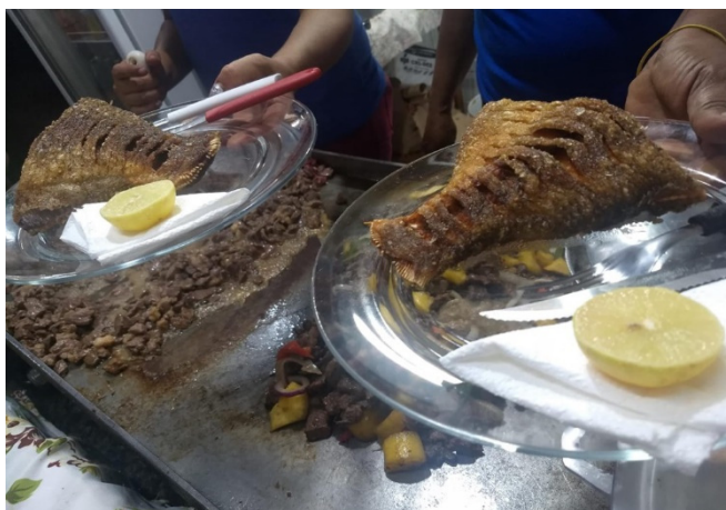
Figura 2 –Tucunaré frito com limão

Em segundo lugar estão os peixes de água doce, sendo nomeado apenas o Tucunaré, que é abundante na região, esses peixes são preparados principalmente fritos ou cozidos com batatas e legumes, com arroz, farinha de mandioca e salada como acompanhamentos, ou com apenas limão (vide figura 2).