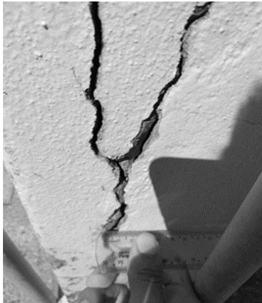
Figura 2: Rachaduras no pilar.