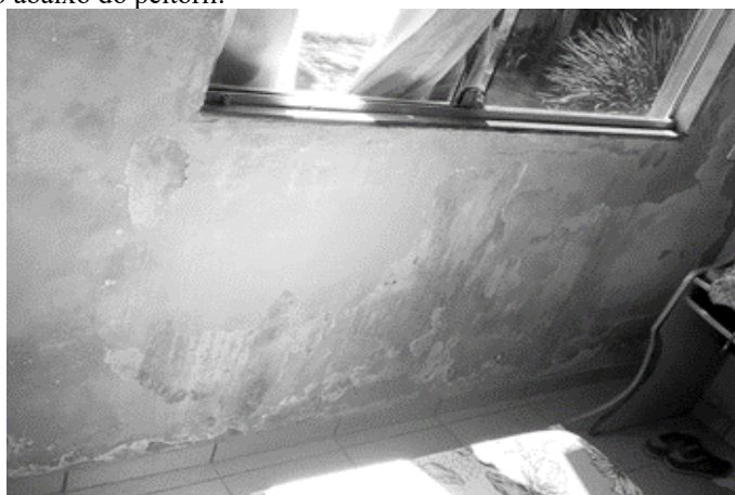
Figura 5: Infiltração abaixo do peitoril.