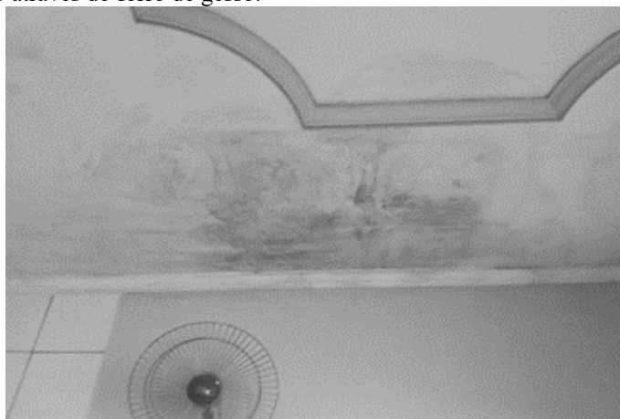
Figura 4: Infiltração através do forro de gesso.