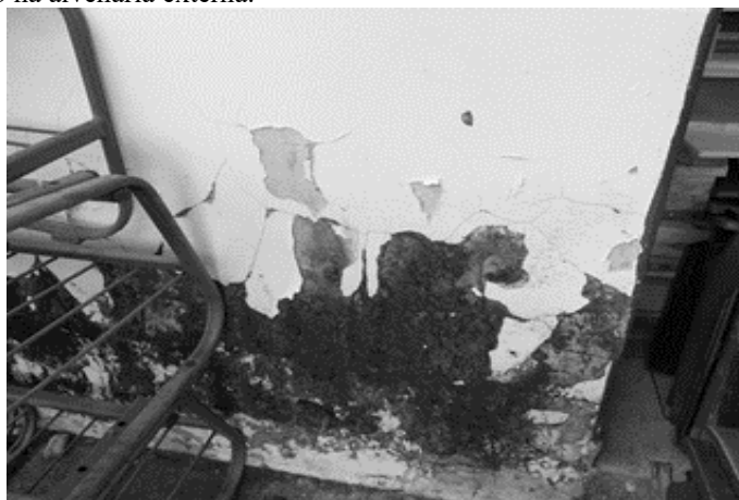
Figura 3: Infiltração na alvenaria externa.