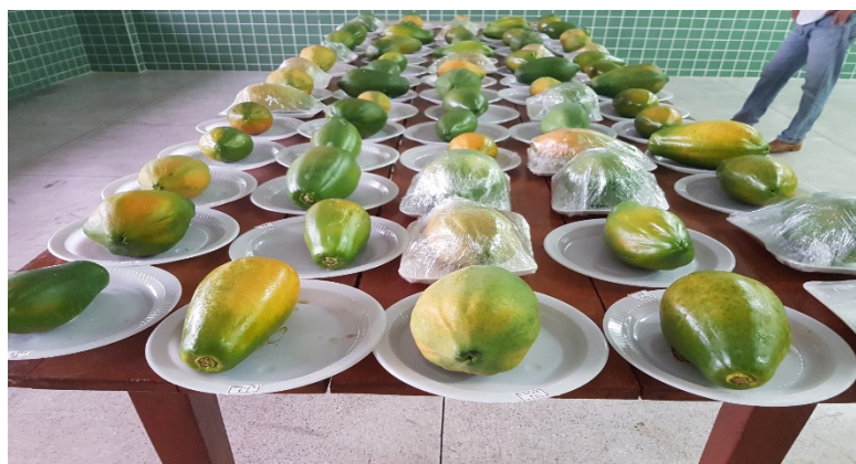
Figura 2 – Frutos acondicionados em recipientes descartáveis e identificados com os tratamentos (revestimentos e época de avaliações) e repetições.

Após o preparo dos revestimentos (Tratamento T2, T3 e T4), os frutos foram imersos de forma a cobrir toda a sua superfície (deixando-se escorrer o excesso), exceto o tratamento T1 (testemunha) e o T5 (filme PVC) em que os frutos foram envoltos pelo filme PVC. Procedida à aplicação dos tratamentos, os frutos foram acondicionados em recipientes descartáveis (identificados com os tratamentos e repetições), dispostos sobre uma mesa, e armazenados a temperatura média de 24,2°C e umidade relativa média de 63,4% (Figura 2).