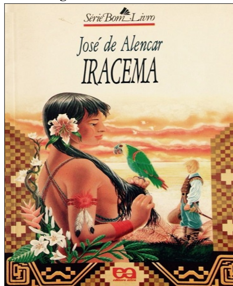
Figura 1 – Obra Iracema

O sentimento de nacionalismo e o amor à pátria é algo que ocorreu entre os poetas e escritores da 1ª geração romântica brasileira, datada de 1836 a 1852, baseando-se no binômio nacionalismo-indianismo, e por isso, esse sentimento de apreço pela nação estende-se em outras obras, como no caso de Iracema de José de Alencar (lançada em 1865):