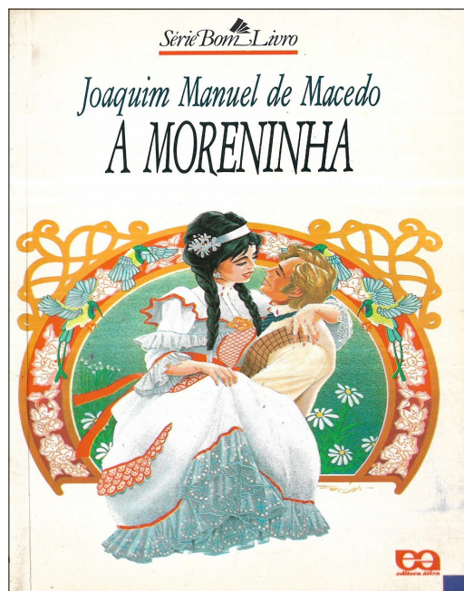
Figura 2 – Obra A Moreninha

Temas como morte, amor não correspondido, tédio, insatisfação e pessimismo marcam a 2ª geração romântica brasileira, datada de 1853 a 1869, baseando-se nas perspectivas ultrarromânticas e Mal do Século, e por isso, esse sentimento de amor e sofrimento é comum em várias obras do Romantismo, como no caso de A Moreninha , de Joaquim Manoel de Macedo (lançada em 1844):