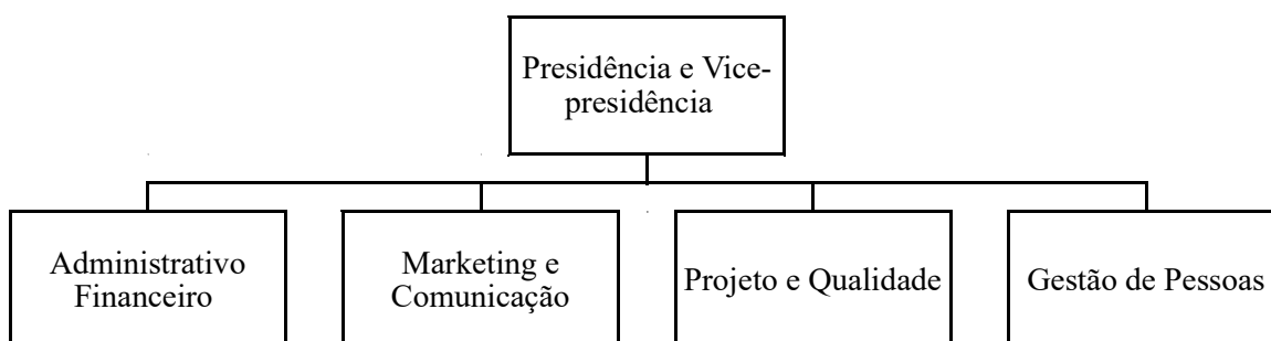
Figura 1- Organograma da Empresa Junior

Foi realizado um estudo sobre a estruturação de uma empresa, bem como definição de um organograma, e atribuições de cada diretoria. Desta forma a Empresa Júnior de Engenharia Civil, se organizou em cinco diretorias, com dois membros em cada uma delas, como apresentado na figura 1.