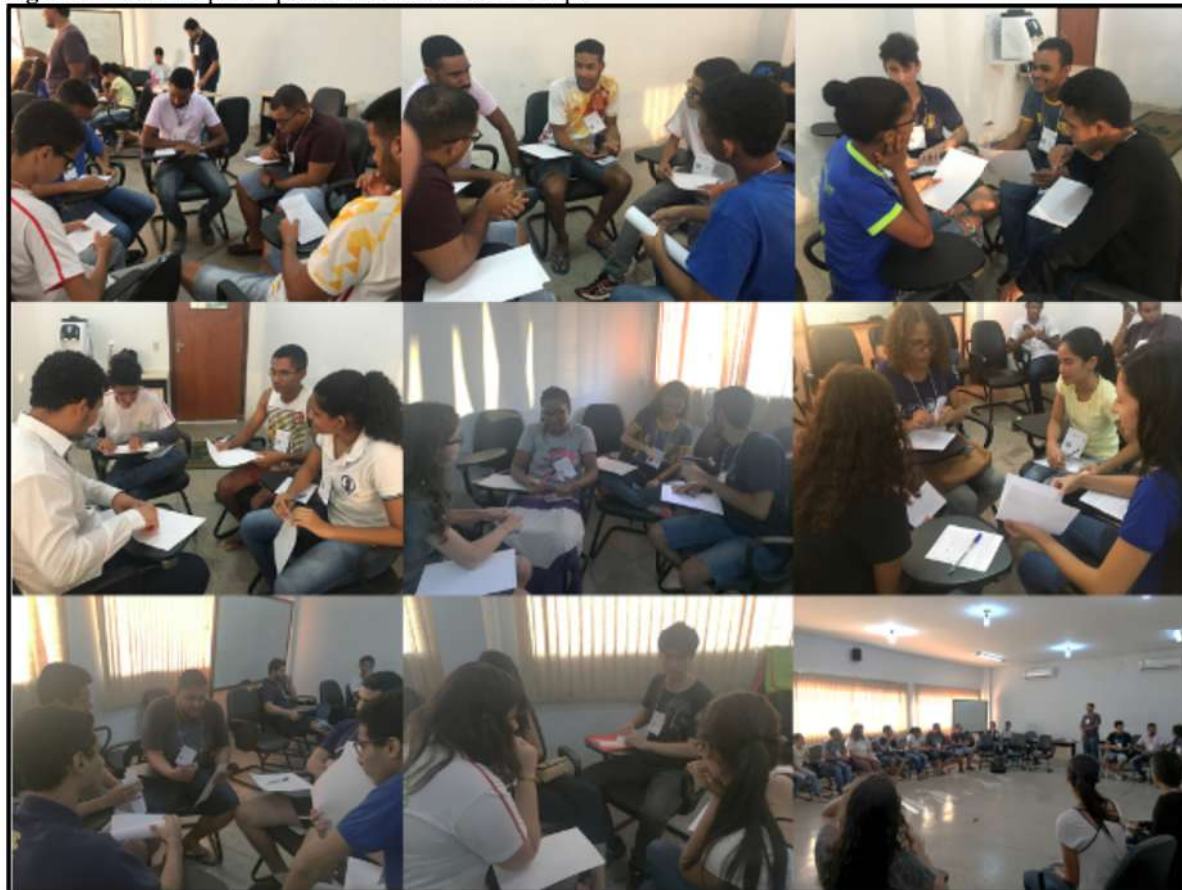
Figura 4 – Alunos participando de dinâmica em Grupo