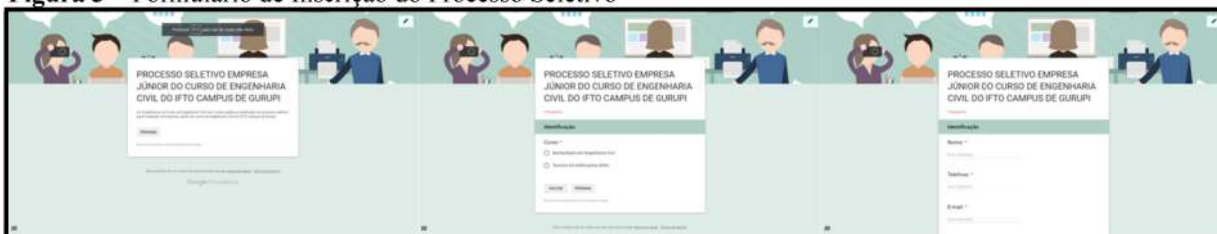
Figura 3 – Formulário de Inscrição do Processo Seletivo

A primeira etapa consistiu nas inscrições de 47 alunos. A mesma foi feita de forma online na plataforma do Google Forms , com perguntas referentes ao Movimento Empresa Júnior (MEJ) (Figura 3).