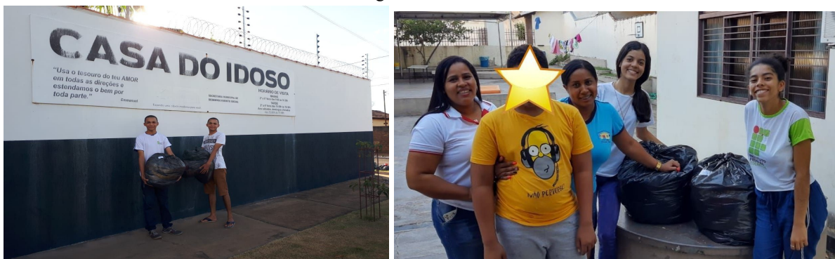
Imagem 4: Doação das peças selecionadas e das que não foram vendidas. A: Doação na casa do idoso. B: Casa de Passagem e Lar Renascer.

Após o evento de vendas, todas as roupas restantes e as já separadas para a doação, totalizando 250 peças, delas 100 foram destinadas à Casa do idoso e 150 à Casa de Passagem e Lar Renascer. Estas foram levadas pessoalmente pelos dirigentes do projeto às organizações selecionadas, eles conheceram de perto como as instituições selecionadas funcionavam e algumas das dificuldades enfrentadas pelas mesmas.