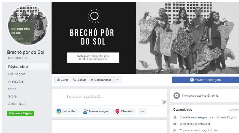
Imagem 2: Perfil do Brechó pôr do Sol no Facebook.