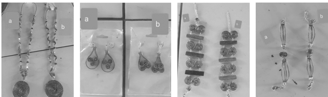
Figura 1: Amostragem de peças de capim dourado utilizadas durante a pesquisa de campo para verificar a preferência do consumidor.

Na primeira etapa, foram amostrados 4 conjuntos de peças produzidas pela artesã, sendo cada conjunto composto por duas peças similares, onde a principal diferença entre as duas peças era que uma tinha a presença de material sintético e a outra tinha sementes e/ou outros materiais naturais do que a outra (Figura 1). A pesquisa foi realizada através da confecção prévia de um questionário binário para mensurar a preferência da comunidade, onde o consumidor ao visualizar cada conjunto escolhia entre a peça a ou b.