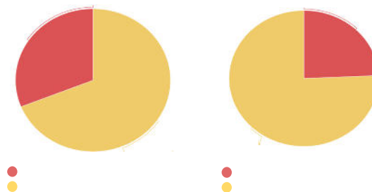
Figura 1 Gráficos dividindo as porcentagens do grupos de alunas que se autodeclararam brancas, amarelas e outros e das que se autodeclararam pretas ou pardas, no ensino médio (gráfico 1) e ensino superior (gráfico 2)

amar.: Amarelas; etc.: Não identificadas.