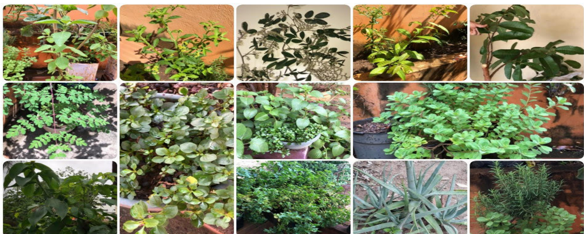
Imagem 1: Plantas medicinais

Dentre as plantas medicinais cultivadas, registradas, como se observa na imagem 1, e identificadas por seus nomes populares durante essa visita, cita-se: a mulatinha, hortelanzão, hortelanzinho, boldo do Chile, boldo sete dores, quitoco, ora-pro-nobis, moringa, erva cidreira e alecrim.