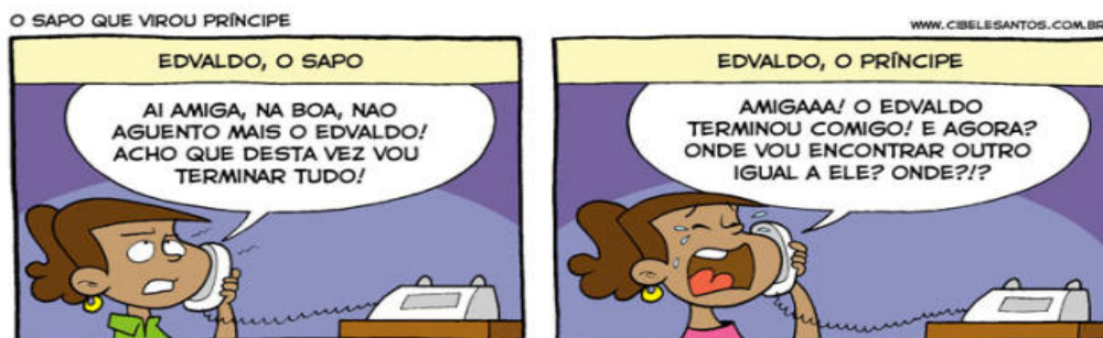
Figura 02: O sapo que virou príncipe

Com base nesses conceitos sobre o plano de conteúdo e o percurso gerativo de sentido de um texto, a respeito dos três níveis/patamares do percurso (fundamental, narrativo e discursivo), analisaremos textos aplicando tais teorias ao texto que constitui o corpus de nossa análise.