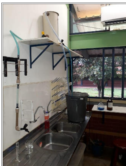
Figura 1 – Filtro para adsorção de corante

O teste foi feito em um sistema de filtros em série, sendo o primeiro composto por 30g de uma mistura de areia e o segundo composto por 6g de carvão ativado do sabugo do milho. O experimento foi realizado durante 25h em fluxo contínuo, a vazão média do sistema foi de 3,4mL/min, e como corante utilizou-se uma solução de azul de metileno a uma concentração de 5 mg/L com pH ajustado a 7,0.