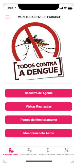
Figura 1. Aplicativo monitora dengue Paraíso

Para isto, é realizado o cadastro dos agentes no aplicativo, conforme Figura 1. As informações e atualizações tanto do agente quanto do monitoramento aéreo são realizados por um administrador.