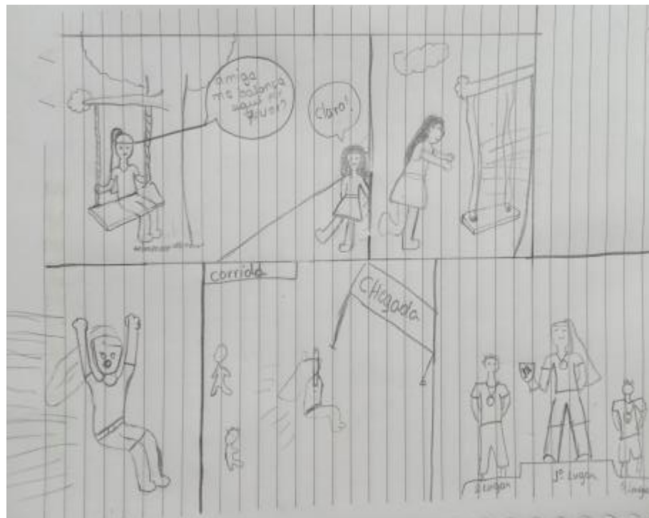
Figura 3 – História em quadrinho produzida por um discente

Finalmente, foi proposto para os alunos que cada um produzisse uma história em quadrinhos, especificamente sobre o conteúdo de quantidade de movimento e impulso, como forma de avaliar o conhecimento abordado, além de estimular a criatividade, comunicação e a autonomia sobre a atividade, construindo o seu conhecimento e tendo o professor apenas como um mediador dessa construção, segue exemplo de uma HQ produzida por um discente da turma na figura 3 abaixo: