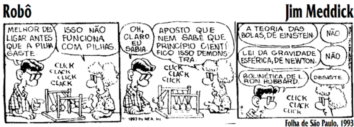
Figura 1 – História em quadrinho utilizada para iniciar o conteúdo de quantidade de movimento

Fonte: Robô, Jim Meddick – (GREF, 1998, p. 16).