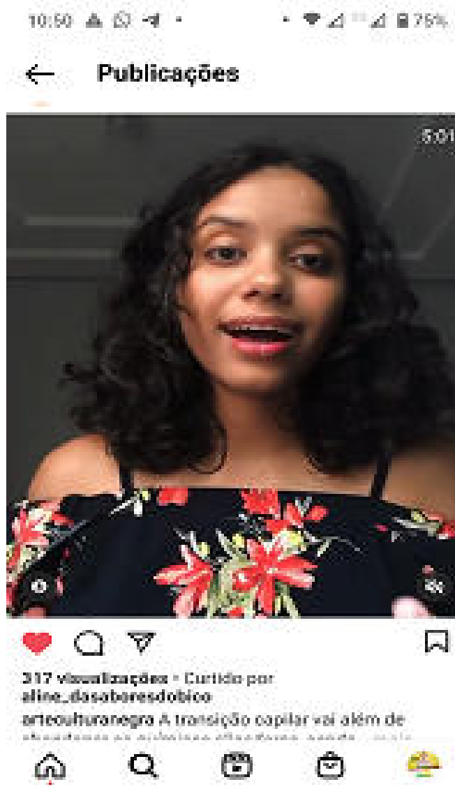
Figura 3 – Vídeo falando sobre transição capilar

Por sua vez, além de facilitar a cognição, os vídeos na educação e nos projetos possuem o caráter do dinamismo, possibilitado pela linguagem simples e objetiva, além de variação de formatos. Os conteúdos, muitas vezes, são mais curtos do que os ministrados na sala de aula, o que pode deixar os participantes mais concentrados (AKERMAN, 2015), consoante à imagem que segue: