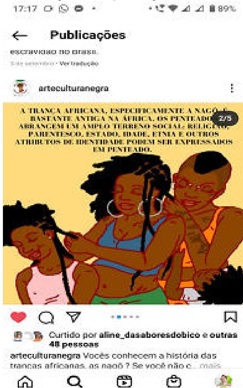
Figura 2 – As tranças com origem africanas

cultura do ver e do ser visto. A grande contradição, contudo, é perceber que, frequentemente, algumas pessoas fazem leituras superficiais das imagens, e por isso, neste contexto, tem-se a figura 2, que retrata ações do projeto em questão: