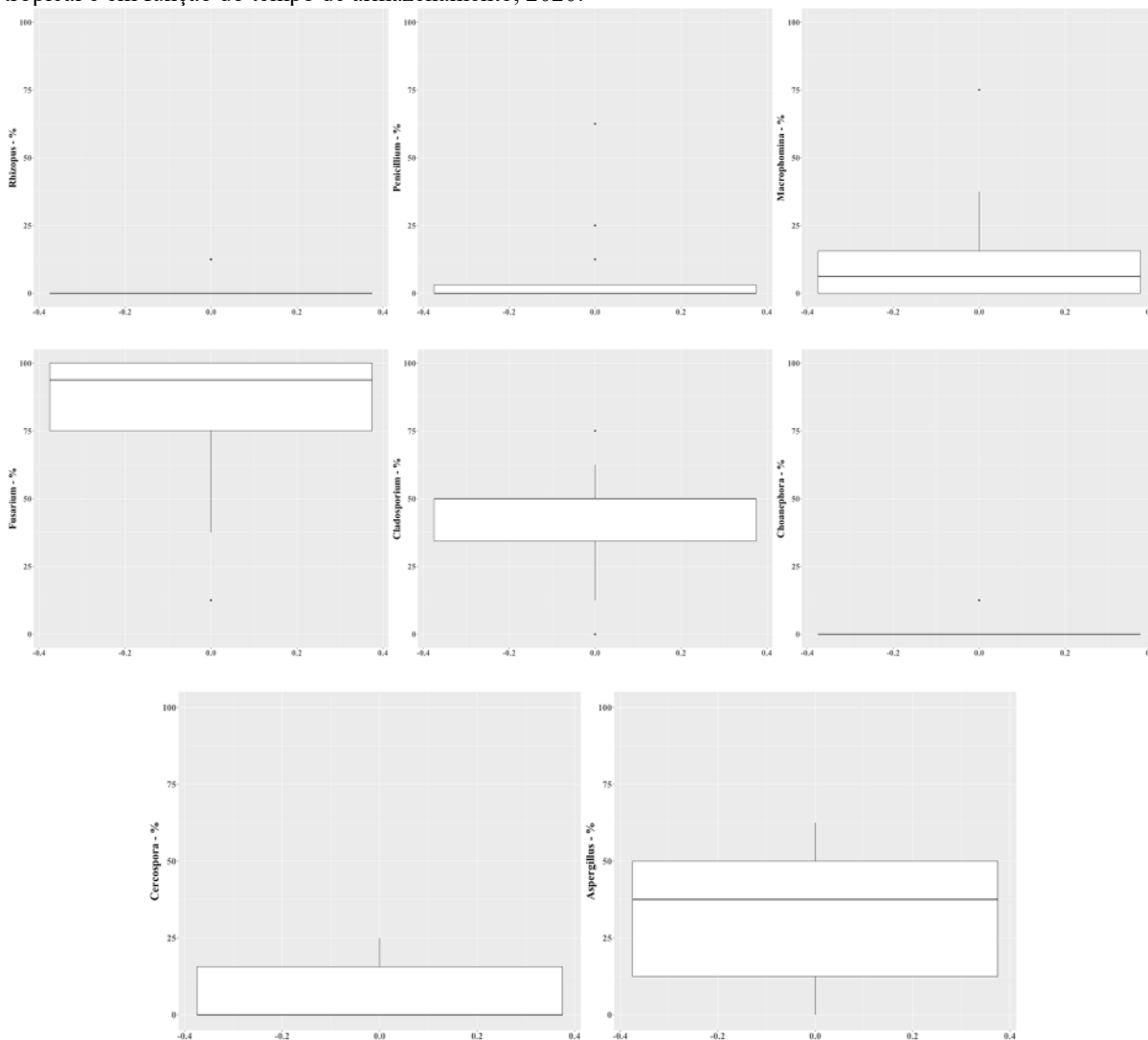
Figura 1 – Bloxplot dos resultados da frequência de fungos em sementes de soja obtidas em condições de várzea tropical e em função do tempo de armazenamento, 2020.

Em relação a incidência de patógenos, somente os dados dos gêneros Aspergillus , Fusarium e Cladosporium são apresentados (Figura 2), com o gênero Fusarium apresentando as maiores médias de incidência (> 22%) e valores máximos (até 97% - 150 dias após a colheita). De acordo com Henning et al. (2005), a presença de patógenos pode reduzir a germinação das sementes, sendo a causa da baixa germinação a campo mesmo quando as sementes possuem altos níveis de pureza física e genética (Diniz et al., 2013).