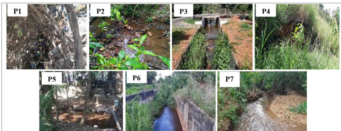
Figura 01 – Trechos onde foram aplicados os protocolos ao longo do córrego Pernada.

para a aplicação dos protocolos de avaliação rápida.