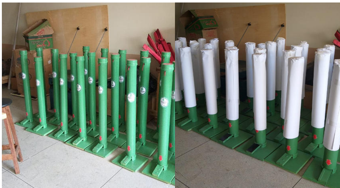
Figura 18 – Suportes prontos para distribuição.