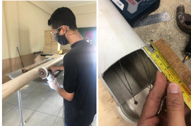
Figura 2 (A esquerda) – Corte dos canos PVC e Figura 3 (A direita) – Abertura realizada no PVC.

Os canos PVC com seis metros de comprimento foram cortados de um em um metro com a esmerilhadeira (Figura 2). Após o corte, foi feita uma abertura de 7,0 x 5,0 cm no local que foi utilizado como base do suporte e onde foi inserido o pedal (Figura 3).