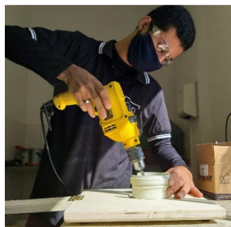
Figura 5 – Fixação do CAP na base.

Por último, o CAP de 100 mm que foi cortado e fixado na base com três parafusos de 4 x 14 mm (Figura 5).