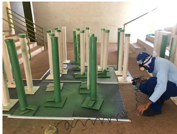
Figura 17 – Pintura dos suportes.

As torres foram lixadas e limpas para que a tinta tivesse uma boa fixação. A pintura foi realizada com um compressor de pintura e pistola (Figura 17).