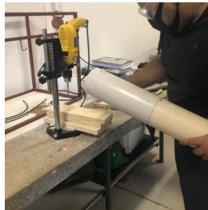
Figura 6 – Realizando abertura no cano PVC.

Pegou-se o cano PVC cortado (que já possuía uma abertura de 7,0 x 5,0 cm) para ser encaixado no CAP 100 mm que foi fixado no compensado base para servir de sustentação do cano 100 mm, e com o auxílio da furadeira fez-se mais uma abertura de 0,50 x 2,0 cm, essa abertura serviu para que o espagete que foi conectado no recipiente de álcool ficasse para fora, (Figura 6).