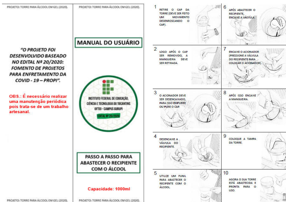
Figura 19 – Manual do usuário.

Cada suporte foi entregue com um manual de utilização fabricado pelos autores do projeto, neste manual o usuário aprende como abastecer o recipiente com o álcool em gel ou líquido (Figura 21).