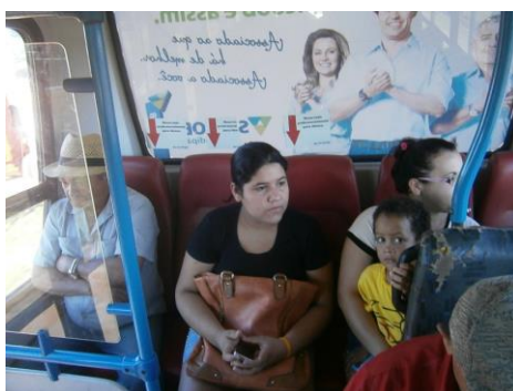
Figura 6 – Linha 2. Identificação central dos assentos destinados à pessoa idosa.

A linha 2, faz o centro comercial, rodoviária, setor milena, setor oeste, marista e setor aeroporto. O tempo gasto para fazer essa rota e de aproximadamente 35 minutos.