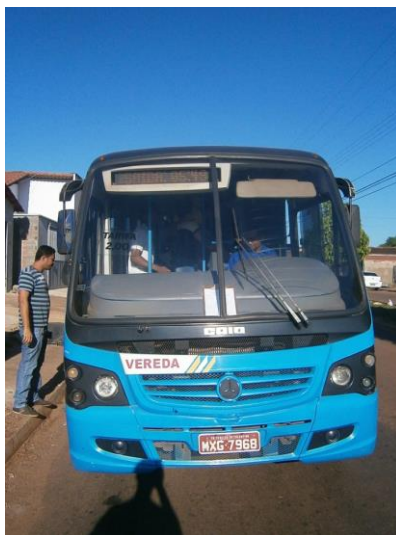
Figura 4 – Linha 2. Ônibus MXG-7968.

minutos, todos os assentos destinados à pessoa idosa são de cor diferenciada, esta empresa traz a cor vermelha para fazer essa distinção.