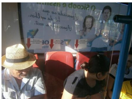
Figura 5 – Linha 2. Assentos destinados à pessoa idosa, com as devidas identificações.