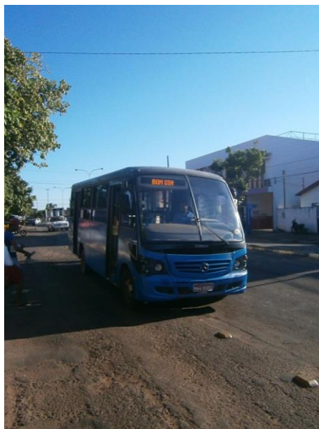
Figura 1- Linha 1, Ônibus MWW-8920.