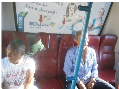
Figura 2 – Linha 1. Assentos reservados a pessoa idosa com identificação.