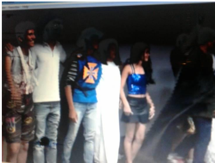
Figura 1 – Apresentação teatral-Gil Vicente 1º ANO B