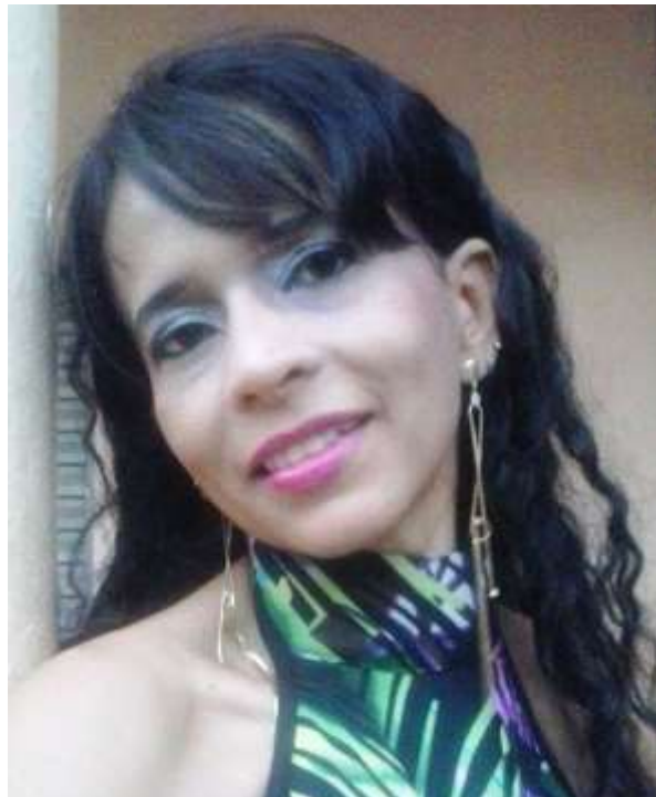
Figura 1 – Estudante com maquiagem estética

Não cabe aqui o julgamento do certo ou errado, mas possibilidades de construção de maquiagem, aqui, proposta para uma mulher poderosa, rica e mandona. Nota-se, portanto que na figura 1, as características do rosto da atriz podem sugerir outras possibilidades de caracterização. Ao sugerir no projeto de extensão que os cursistas pudessem analisar e conhecer os tipos de rosto, sobrancelhas, lábios, pele e formatos de nariz, percebeu que a atriz apresenta sobrancelhas caídas, o corte de cabelo com franjas que dificultam a apresentação de uma maquiagem teatral.